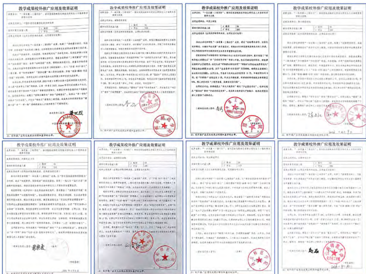
图 9. 校外推广应用效果证明

本成果所凝练的“一体双翼·三维四阶”体系化培养理念与实施路径，因其逻辑的严密性、操作的可行性和成效的显著性，产生了广泛的示范引领效应。成果核心经验已被中国科学院新疆理化技术研究所、河南农业大学、南阳师范学院等多所省内外高校的化学、化工、材料等相关院系系统调研、借鉴与采纳，用于重构其研究生培养方案和课程体系，据不完全统计，惠及研究生已达数千人。权威专家在成果评价中指出：“该成果将国家战略需求有机、深度地融入研究生培养全过程，实现了科研优势向育人优势的高效、系统转化，路径清晰，成效显著，为具有雄厚科研基础的高校，特别是中西部高校的研究生拔尖创新人才培养，提供了经过实践检验的、可复制推广的成功范式。”