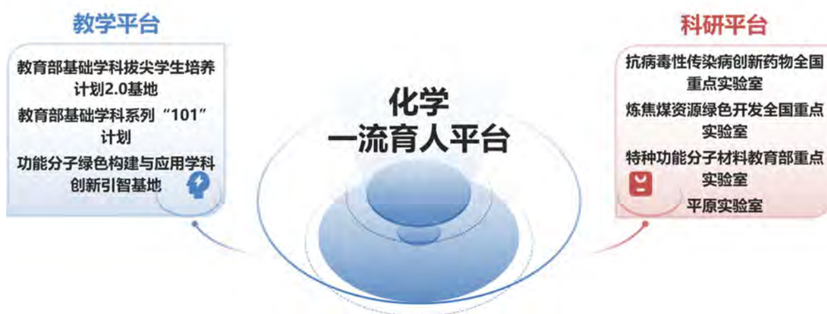
图 8. 育人平台建设

本培养体系已成为驱动郑州大学化学学科高质量发展的核心引擎。高水平、成建制的研究生团队成为承接和完成国家级重大科研任务的主力军，为学科产出标志性成果提供了关键支撑，直接推动了化学学科 ESI 排名进入全球前 0.114%，并稳居世界前列。人才培养的卓越声誉与成果，也成为学科汇聚高端人才、获批“教育部拔尖学生培养计划 2.0 基地”与“化学学科 101 计划”等国家级育人平台的核心竞争力，实现了“优秀人才产出”与“一流学科跃升”同频共振、相互成就的生动局面。