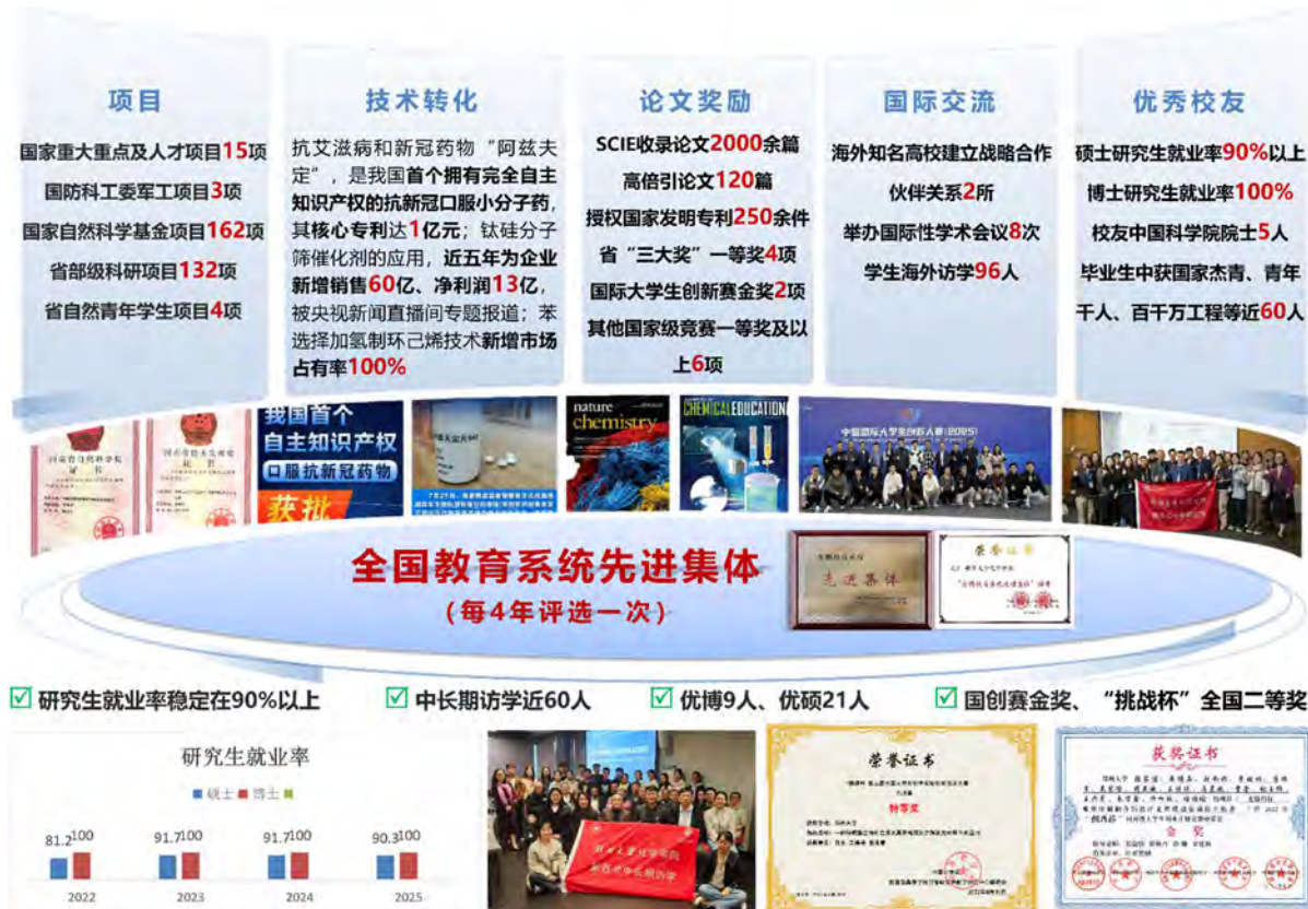
图 7. 多样化的育人成果

成果实施以来，研究生培养质量实现系统性跃升。学术创新能力方面，研究生作为骨干力量，深度参与国家重大、重点类项目 15 项、重大军工专项 3 项；以第一作者或主要贡献者在 Science、Nature 及其子刊等国际顶刊发表论文取得历史性突破，高水平论文累计超 2000 篇。实践攻关能力方面，研究生在“阿兹夫定”全链条研发、绿色催化技术工业化、特种国防材料研制等国家重大任务中担当重任，获授权发明专利百余项，其研究成果直接支撑项目获国家技术发明一等奖（初评通过）、河南省科学技术一等奖等高层次奖励。毕业生竞争力强劲，超过 40% 进入国防军工、核心制药、高端材料等国家战略关键领域，深受用人单位好评，被誉为“理论基础扎实、工程思维强、富有国家情怀与攻坚精神”，多名校友已成长为学术带头人、技术领军人物或院士候选人，形成了拔尖人才持续涌现的“郑大现象”。