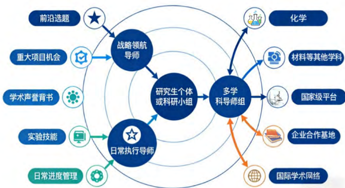
图 6. “双领航-多学科”资源传导与协同网络

为保障上述方法有效落地，创新导师聘任与指导机制，实行“双领航导师制”。为每位拔尖研究生配备一位 战略领航导师 （通常为院士、杰青等）和一位 日常执行导师 。战略导师负责把握学术方向、对接顶尖资源、启迪战略思维；执行导师负责科研日常指导、技术细节打磨与过程管理。同时，依托重大交叉项目，自然形成由化学、化工、材料、药学等多学科教授组成的“ 导师组 ”，对研究生进行多角度、跨领域的集体指导。这一模式不仅将顶尖科学家的智慧直接注入培养一线，更通过多学科导师组的“ 集群效应 ”，为研究生攻克复杂系统难题提供了全方位的学术支持网络，真正实现了“ 大师引领、团队滋养、交叉创新 ”的育人生态。