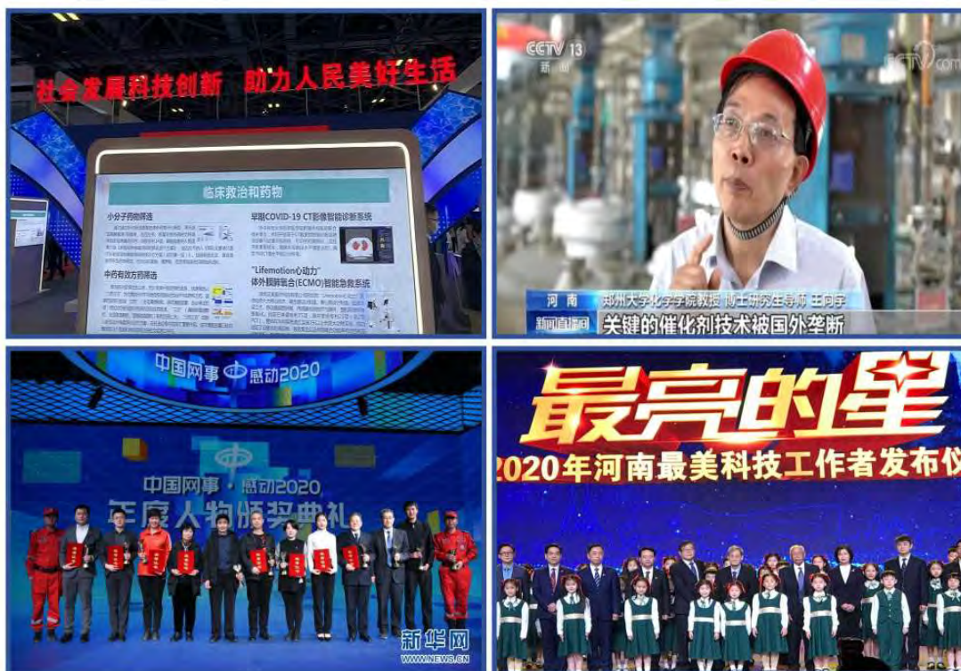
图 10. 新闻媒体报道

本成果成功探索并实践了一条依托高水平科研、深度服务国家战略需求的研究生拔尖创新人才培养新路径。它不仅显著提升了郑州大学化学学科的研究生培养质量与学科实力，更以其体系的科学性、实效性和可推广性，产生了超越校际的广泛影响力，为我国研究生教育的内涵式发展与改革创新贡献了坚实的“郑大智慧”与“中原范式”。