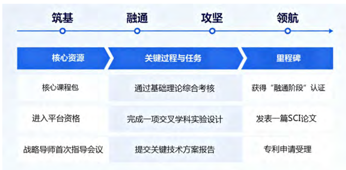
图 5. “三维四阶”路径的标准化操作流程

为解决培养过程“碎片化”问题，我们依据创新能力生成规律，设计了清晰的“三维四阶”标准化培养路径。三维立体化支撑体系包括将“科学家精神”、“工程伦理”与“家国情怀”融入开题、组会、答辩各环节，以重大工程案例开展情境思政的价值塑造维；打破学科壁垒，构建“核心基础+前沿交叉+技术工具”模块化课程体系，如开设“团簇化学与器件”、