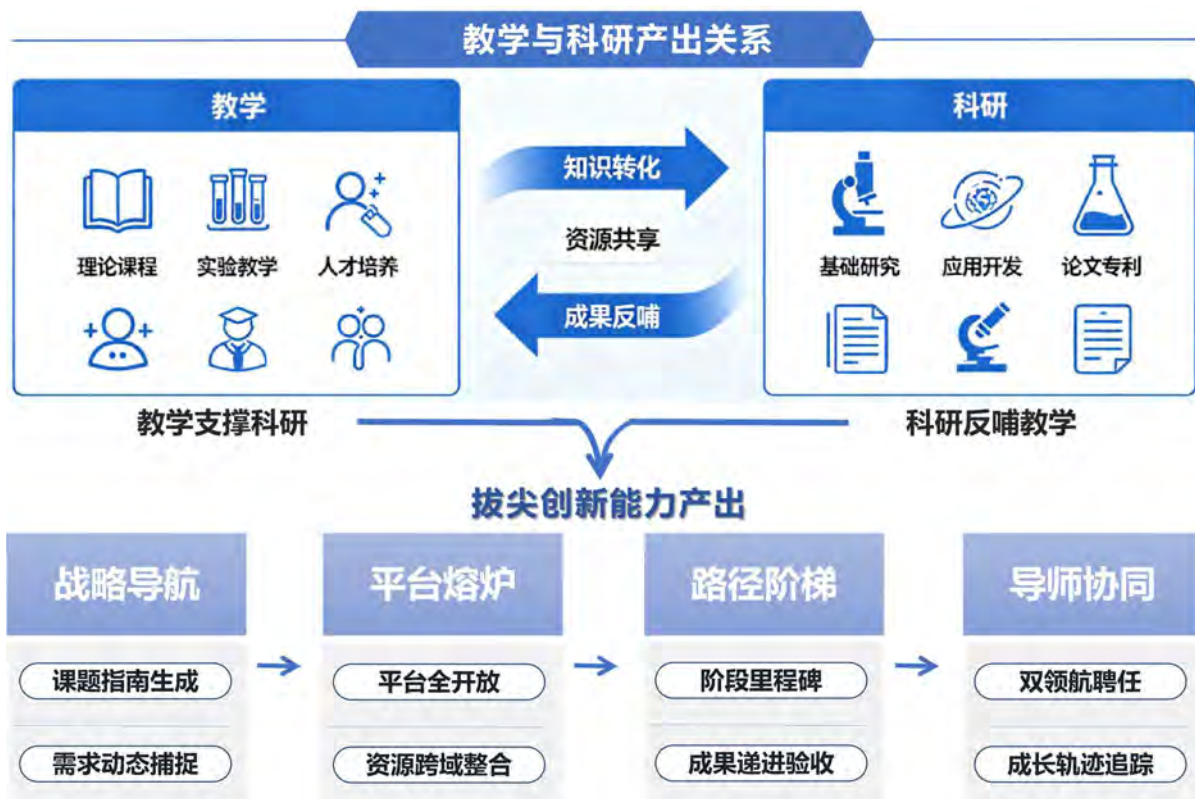
图 4. 方法论四大支柱与实施全景

针对教学中的科研训练与重大需求脱节、学术培养与使命塑造分离、个体成长与体系支撑失调等问题，我们以“体系化设计、实战化导向、生态化支撑”为原则，系统构建并实施了以下四大解决方法，形成完整闭环，显著提升了教育质量和人才培养效果。